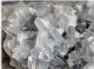
کوارتز (SiO 2 )